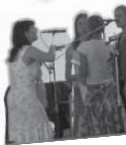
Mládežníci z Bratislavy - Trnávky