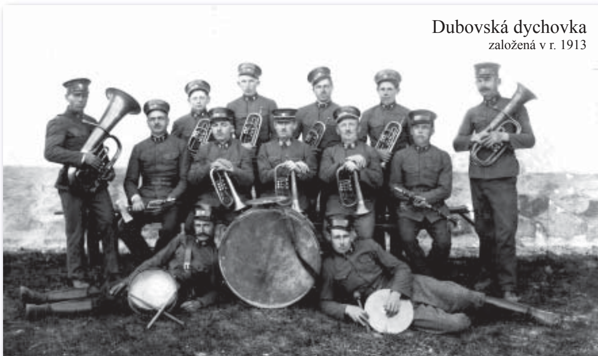
Dubovská dychovka založená v r. 1913