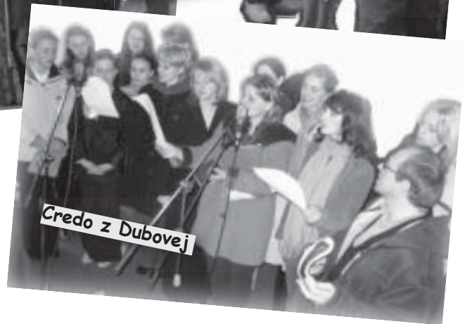
Credo z Dubovej

Výťažok z dobrovoľného vstupného venujeme v celom rozsahu na pomoc našim trpiacim bratom a sestram v Libanone.