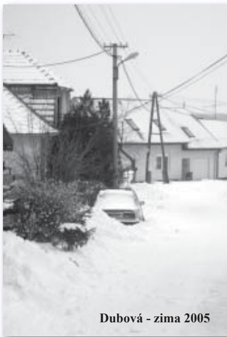
Dubová - zima 2005

Malá podhorská dedinka zahalená do tmavej noci, osvetlená drobnými hviezdami a krásnym mesiacom a uprostred nej rozsvietený kostol. Jednoduchý obraz našej vianočnej noci nám pripomína bedliacich i spiacich pastierov neďaleko Betlehema. Strážili svoje stáda, keď zrazu uprostred nich zažiarilo svetlo.