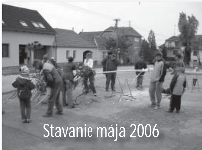
Stavanie mája 2006