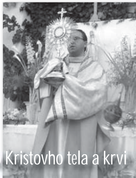
Procesia na sviatok Najsvätejšieho Kristovho tela a krvi