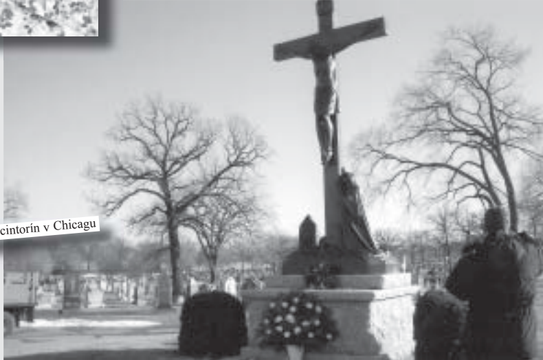
Slovenský cintorín v Chicagu

S úctou si na ňu spomína celá rodina, aj občania, čo ju poznali v mladosti ako Dubovanku. Nech odpočíva v tíškom pokoji.