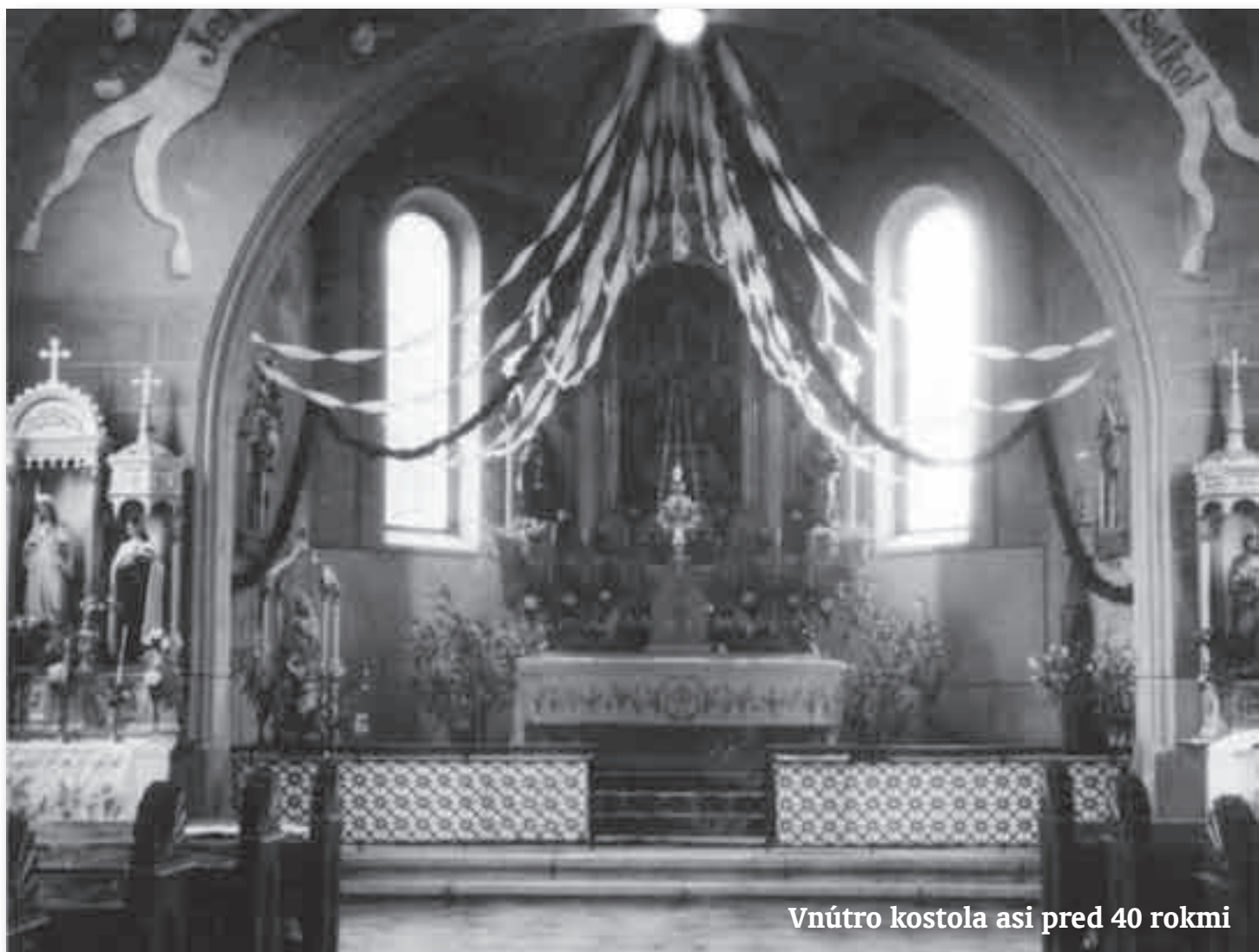
Vnútro kostola asi pred 40 rokmi