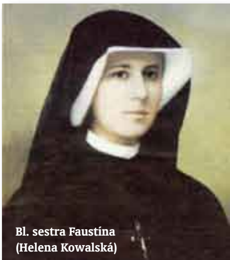
Bl. sestra Faustína (Helena Kowalská)

„Sľubujem, že duša, ktorá bude tento obraz uctievať, neostane zatratená. Sľubujem jej už tu na zemi víťazstvo nad nepriateľom, najmä v hodine smrti. Ja sám ju budem chrániť ako svoju časť. Domy a dokonca mestá, v ktorých sa bude tento obraz uctievať, zachovám a ochránim.“ Toľko z prekladu zjavenia Pána Ježiša sestre Faustíne.