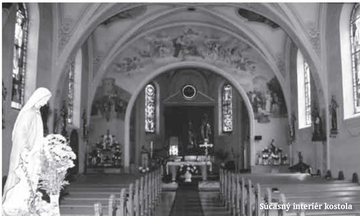
Súčasný interiér kostola