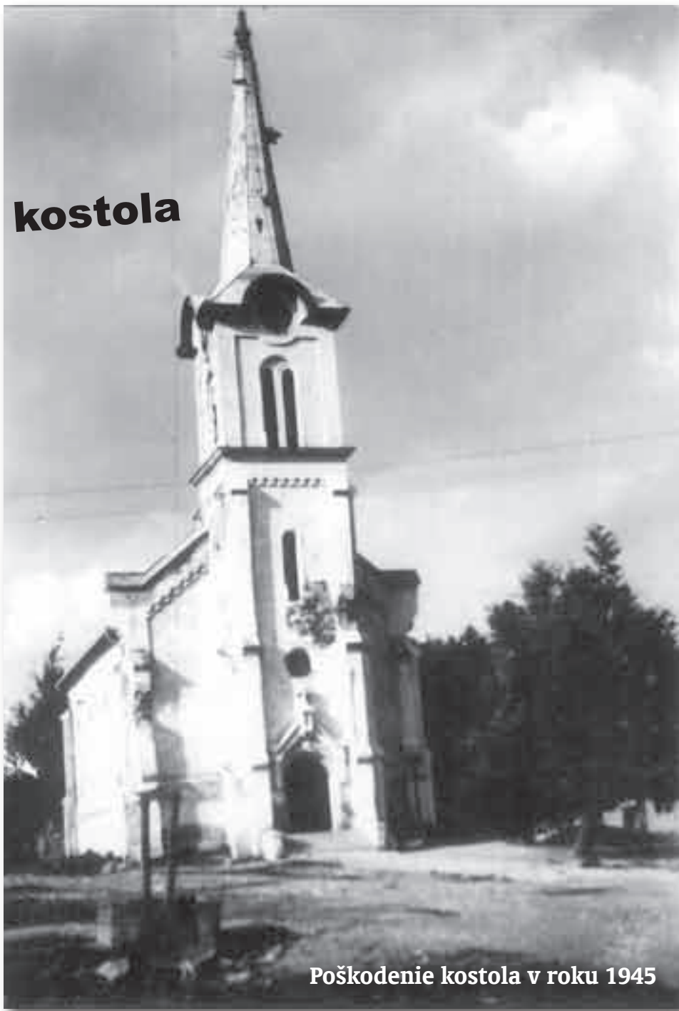
Poškodenie kostola v roku 1945